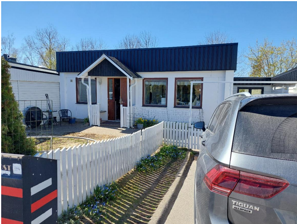
TIBASTEN 27 TIBASTISTIGEN 26, 144 33 RÖNNINGE

Denna besiktning är utförd på uppdrag av säljaren . Observera att du som köpare har en egen långtgående undersökningsplikt. För att uppfylla en del av din undersökningsplikt och för att juridiskt överta detta besiktningens utlåtande krävs att du kontaktar besiktningens man för utförande av en köpargenomgång. I annat fall har besiktningens man inget juridiskt ansvar gentemot en köpare. Observera att en köpargenomgång skall utföras senast 6 månader från det att säljaren låtit besiktiga sin fastighet, en genomgång kan inte utföras efter tillträdet till fastigheten.