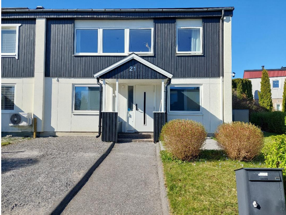
KANTARELLEN 19 KANTARELLSTIGEN 21, 144 40 RÖNNINGE

Denna besiktning är utförd på uppdrag av säljaren . Observera att du som köpare har en egen långtgående undersökningsplikt. För att uppfylla en del av din undersökningsplikt och för att juridiskt överta detta besiktningsutlåtande krävs att du kontaktar besiktningsmannen för utförande av en köpargenomgång. I annat fall har besiktningsmannen inget juridiskt ansvar gentemot en köpare. Observera att en köpargenomgång skall utföras senast 6 månader från det att säljaren låtit besiktiga sin fastighet, en genomgång kan inte utföras efter tillträdet till fastigheten.